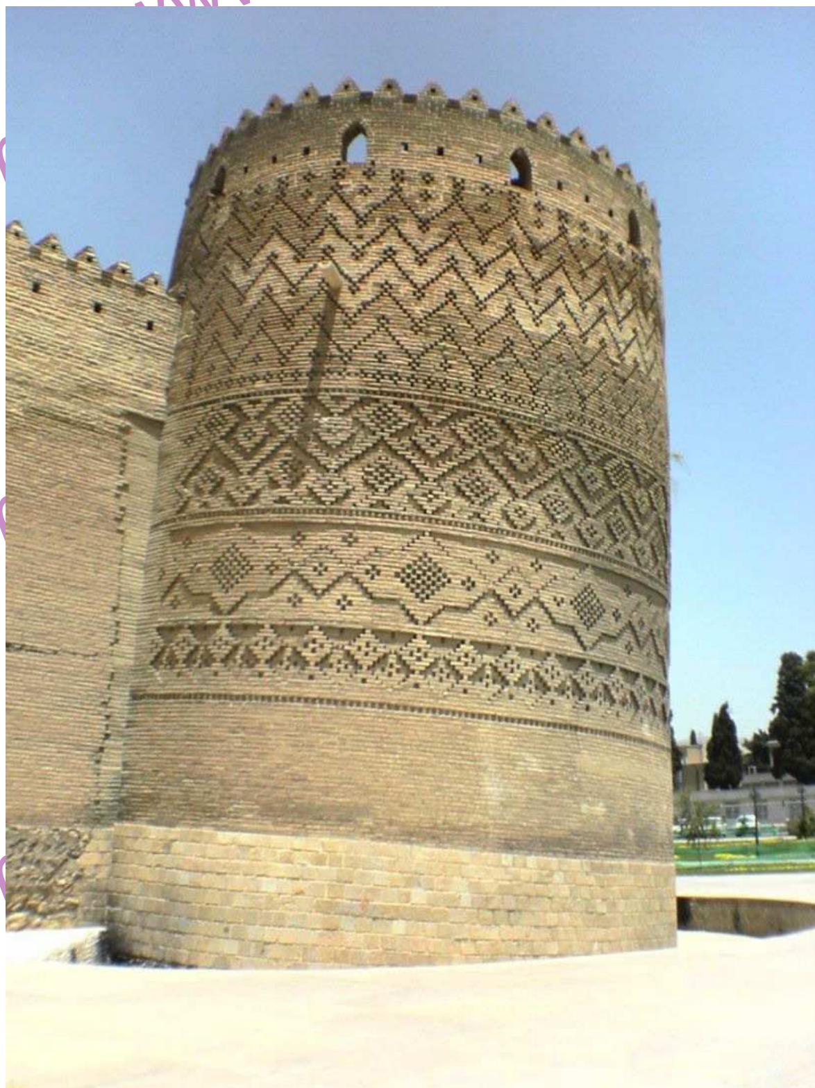
میدان شهدا (شهرداری سابق)