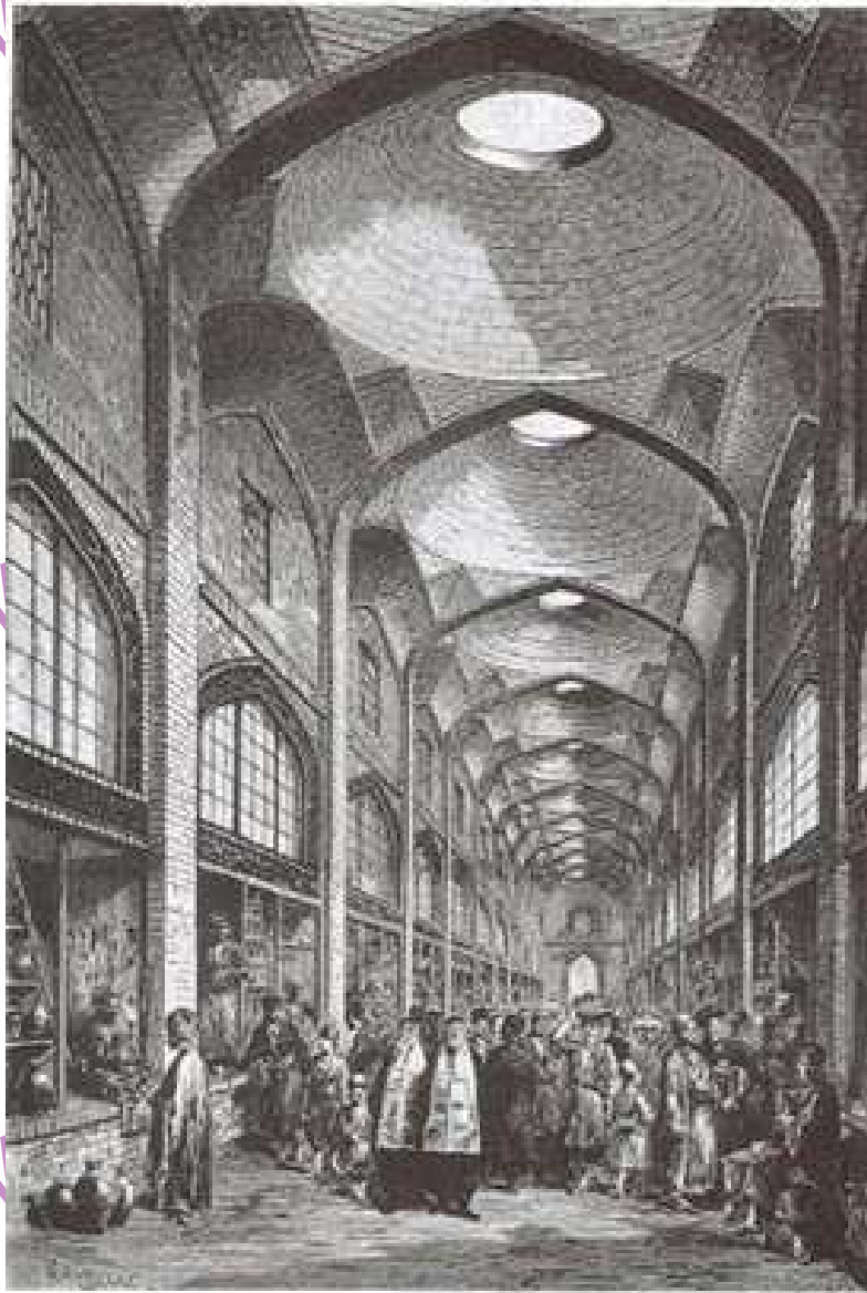
جنب حرم مطهر شاهچراغ (ع) - تقاطع خیابان لطفعلی خان زند