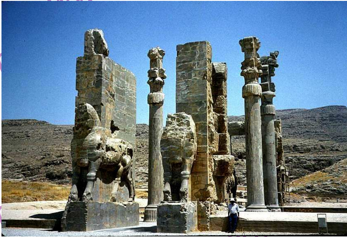
کیلومتر ۵۵ جاده شیراز - اصفهان