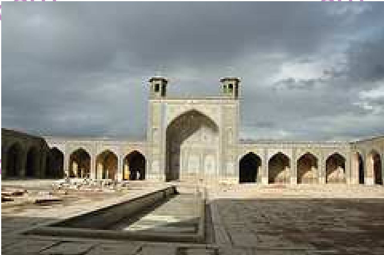
خیابان لطفعلی خان زند - خیابان طالقانی - رو به روی کتابخانه شهید دستغیب